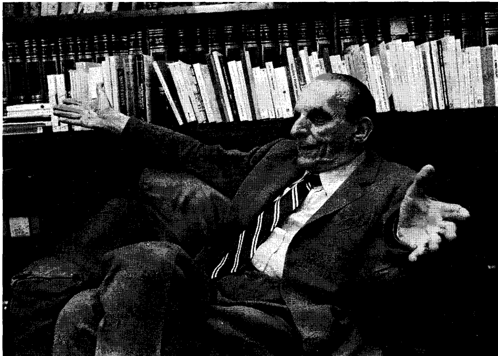
Norberto Bobbio nella sua casa torinese (26 giugno 1978)